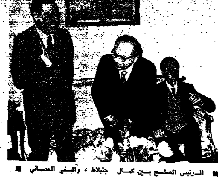
الرئيس الصلح بين كمال جنبلاط، والسفير الكويتي